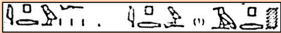
شكل رقم (1) يوضح اللفظ المصري القديم الذي يشير إلى الأثاث الخشبي "المقصورة" نقلاً عن د. محمد راشد حماد.

يبدو أن هذا الطراز من المنشآت تم صنعه واستخدامه خلال الدولة الحديثة في مصر القديمة حيث أن اللفظ الذي أطلقه عليه المصري القديم هو Ipdw أو 3pdw ويرجح هذا أن اللفظ الأخير قد ورد بالنص الذي يصاحب النجارون اللذين يقومون بصنع حليات المقاصير، وهذا يظهر في شكل رقم "1"، كما يرجح أيضاً أن هذين اللفظين يشيران إلى الأثاث الخشبي بوجه عام (1)، ومنه ظهر لفظياً مسمى المقصورة عند المصريين القدماء مع اختلاف الوظيفة في العصر الإسلامي.