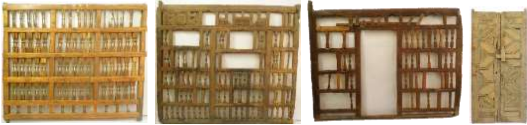
العناصر المعمارية المكونة للمقصورة" الباب الخشبي، الواجهة الشرقية، الواجهة الغربية، الواجهة الجنوبية".